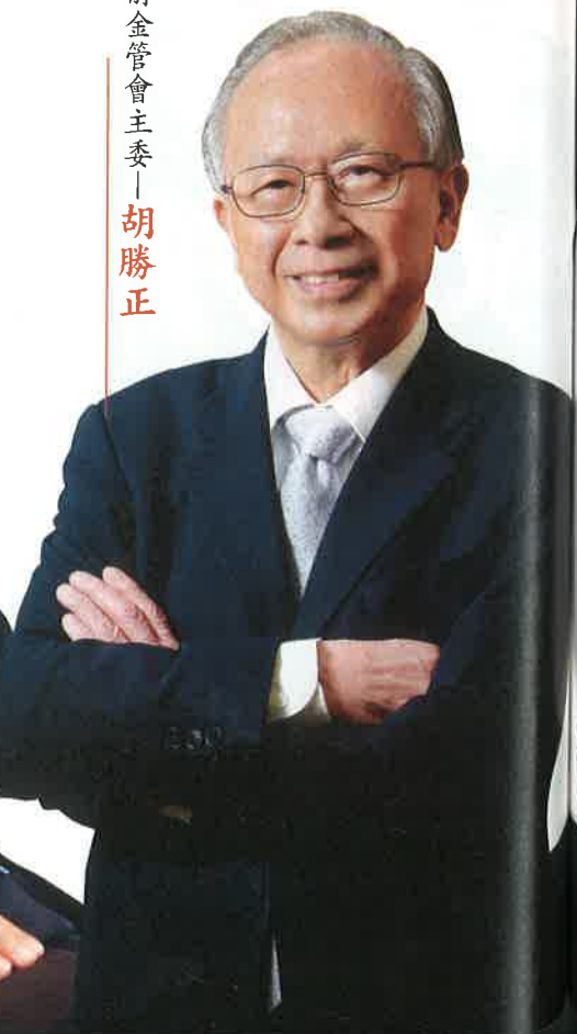
前金管會主委——胡勝正