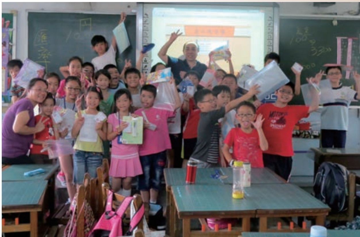
金融達人 捨我其誰

未來，本院更將一秉「回饋社會」的初衷，將這班金融教育列車開向全國各地，廣播金融知識的種子，讓全國的學童們都能在日趨複雜的金融世界裡，享受金融發展所帶來的豐碩果實。