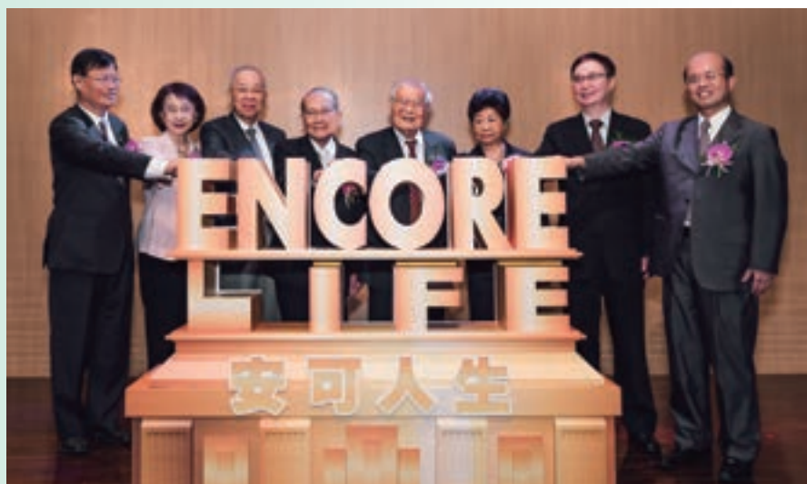
資深金融人才社會回饋服務平台啟動典禮

紙本問卷填寫之作業。學員可利用手機、平板等智慧型載具填寫問卷，善用科技不僅達到環保的目標，針對學員對活動的反映與回饋，企劃及服務同仁更可即時地一手掌握，並及時地回應客戶反映，落實感動服務。