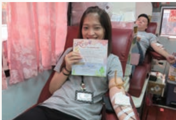
捐血有愛、助人利己、快樂常在