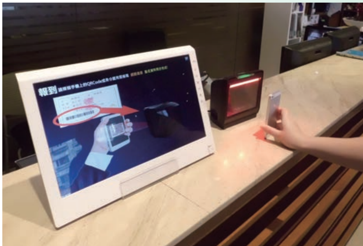
學員利用手機 QR Code 進行上課報到

網際網路在現代社會裡已經成為了日常生活不可或缺的一部分，為提倡環保及順應無紙化趨勢，本院於 105 年 3 月 15 日起，推出線上問卷及線上證書等措施。凡參加本院時數 9 小時(含)以下課程(特定法定班次除外)，不再提供紙本證書，學員可自行至本院網站下載，實施後市場反應良好；學員完成課程報到後，本院將發送報到成功通知簡訊，內含線上課後問卷填寫連結，以取代過去