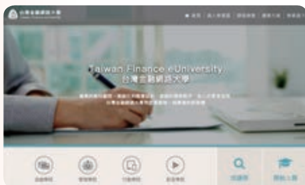
全新台灣金融網路大學網站