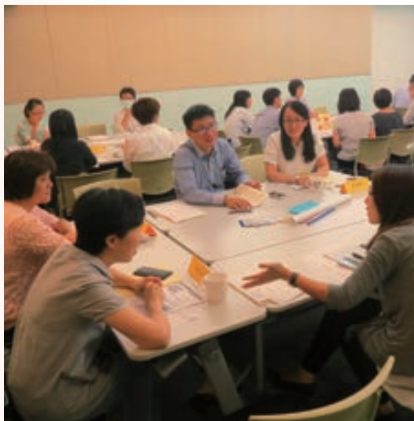
8月講師充電學堂上課實況