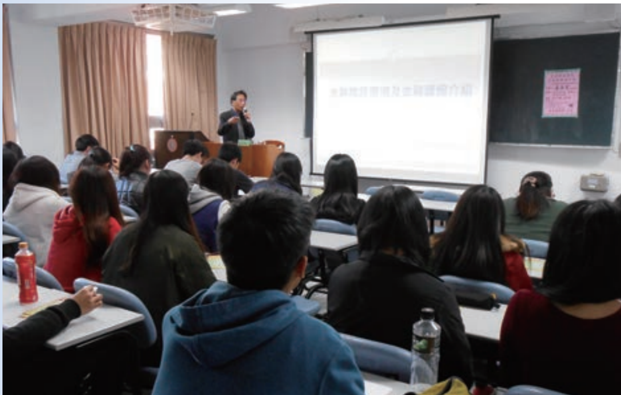
2016 年校園金融職涯講座