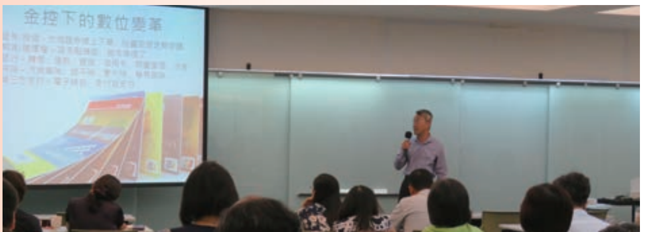
7月趨勢分析講座——大數據應用與策略規劃