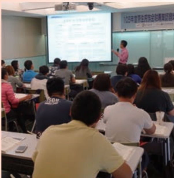
8月「105年度原住民金融專業認證培訓專班」