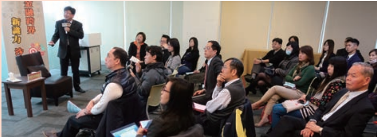
3月金融跨界新識力沙龍 Next Big Thing——物聯網產業趨勢與創新