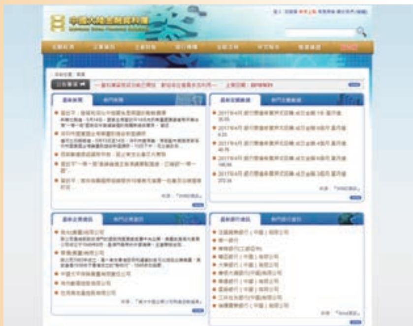
金融研究所建置的「大陸金融資料庫」 首頁內容

後，本資料庫的前台已由原先的七大資訊板塊，擴增到九大資訊區塊：新聞、宏觀經濟、企業資訊、企業財報、銀行機構、法規動態、金融法規、推廣議題與研究報告。截至 2016 年底，本資料庫主要已收錄：中國大陸宏觀經濟指標 64,841 筆、中國大陸銀行業財務資訊 296 家及基本資料（含公司治理相關資訊）385 家、中國大陸企業基本資訊 165,248 家、中國大陸上市企業財務報表 3,045 家、中國大陸經濟金融法規 26,092 條。亦收集重要統計資訊、法規與經濟金融議題開關推廣議題服務、短觀中國專欄與中國熱詞百科。展望未來，本院仍將於有限資源內賡續進行資料之收集、篩選、分析與網站系統平台之改進工作，提供資料庫會員電子報等加值服務。為順應金融大數據潮流，更將在客觀條件許可下逐步建置中國大陸企業之信用風險資訊平台，為台灣金融業者與學術界提供更有價值之服務。