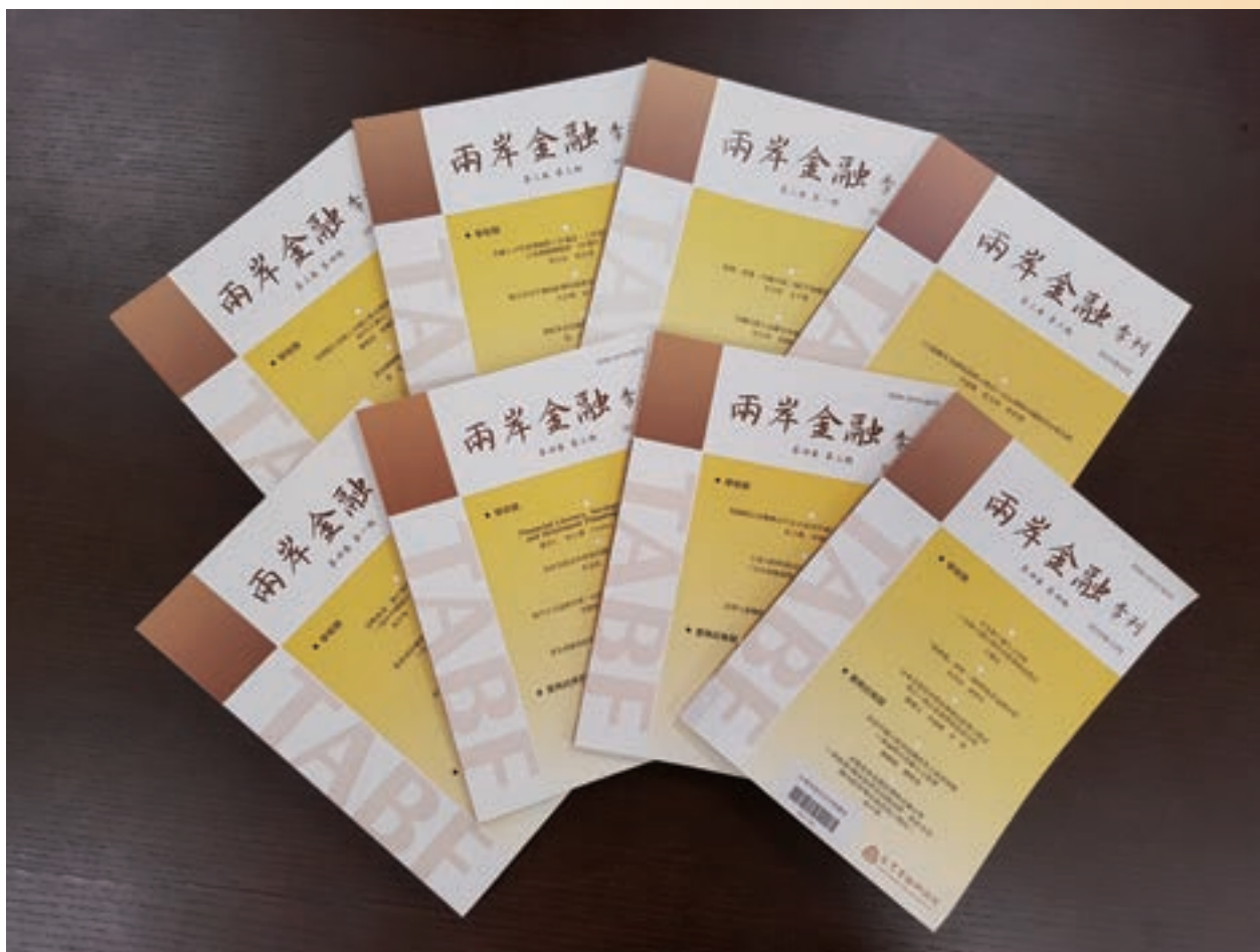
金融研究所發行之兩岸金融季刊

綜觀本所近年來積極參與各項金融與經濟政策議題，擴展研究多元化之目標，本所經由雙週出刊的「兩岸金融電子報」，提供臺灣與中國大陸最新的政經情勢；每季出版的「兩岸金融季刊」，以嚴謹的學術分析及實務面的議題探討，剖析當前兩岸金融的趨勢；每年度出刊的「金融業營運趨勢展望報告」，調查金融相關產業最新的動態資訊並提供最新的發展趨勢，為臺灣金融產業克盡資訊分享的交流平台。本所2016年共計發行26期「兩岸金融電子報」、10項受託計畫與17項自提計畫，並對當前經濟和金融等各項重大議題舉辦21場大型研討會（台灣金融論壇系列、兩岸金融交流講堂系列）與專家座談會，以掌握國際經濟與金融的最新情勢。