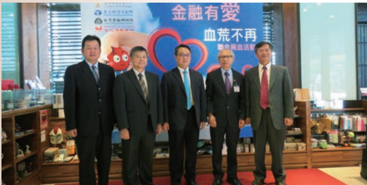
企業不只是獲利的工具，更應是負責任的公民