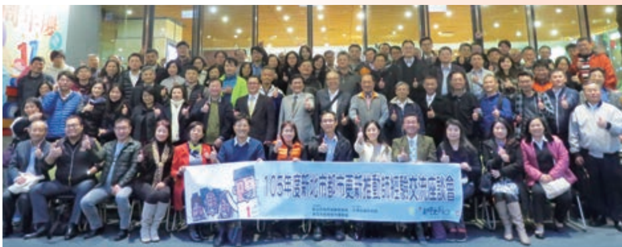
12月「新北市都市更新推動師經驗交流座談會」

傳統「教」與「學」界線，課中雙向深度對談激發多元思維，課後微學習影片鞏固訓練遷移，教學不再侷限於教室內，成功開創學習新視野。另一方面，為順應金融業科技創新潮流，2016年推出全新行動版金融網路大學網，為金融從業人員提供跨裝置的舒適學習環境，並積極開發數位金融、金融基礎實務系列課程，協助金融從業人員及社會大眾自我進修，提升職場競爭力！