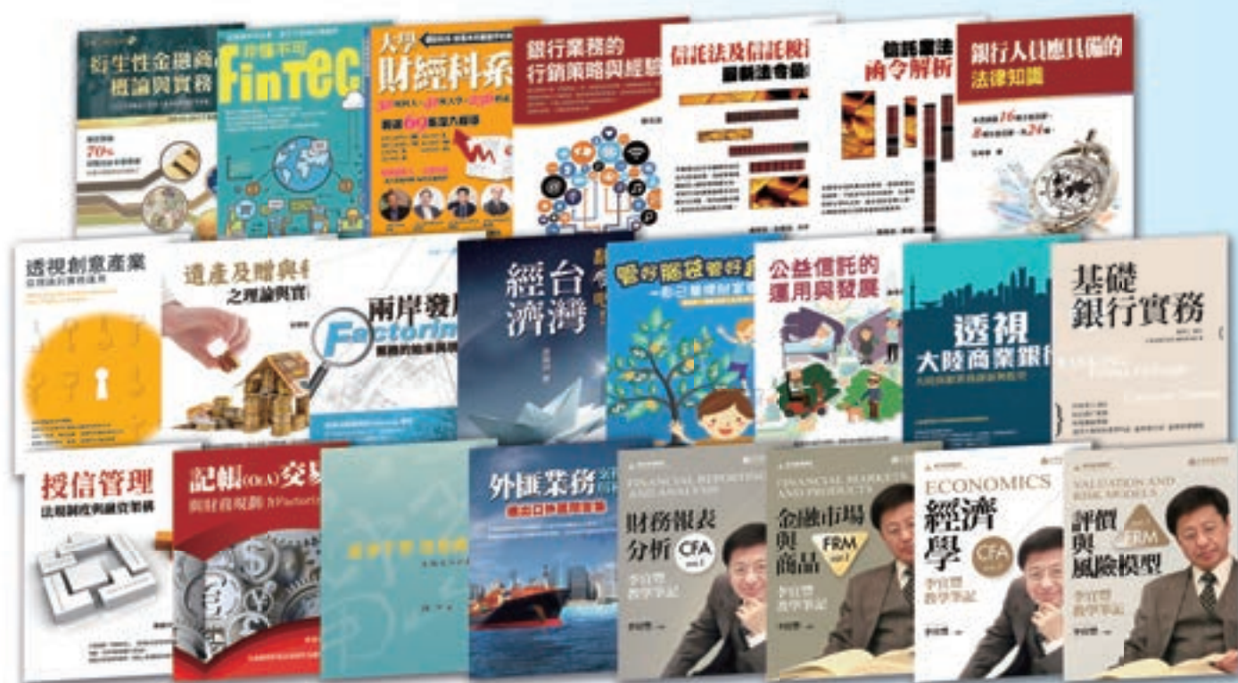
2016 年各項新種出版品，包含金融測驗參考用書、國際金融新知及銀行法令遵循制度等。