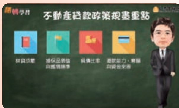
11月翻轉學習課程——課後微學習影片