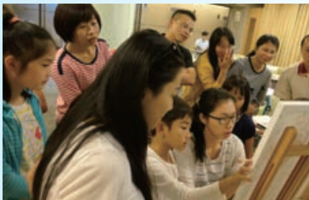
數字油畫——畫布上旅行親子課程

延續近年來文藝、藝術的風潮，金融廣場書店積極與業界合作，舉辦多場藝術展，包含「數字油畫——畫布上旅行」特展及親子課程，藉由數字彩繪和編碼油畫，讓每個人輕鬆完成令人讚嘆的藝術作品，以藝術調劑身心、舒緩壓力，享受繪畫過程的無窮樂趣，釋放心中的藝術魂！