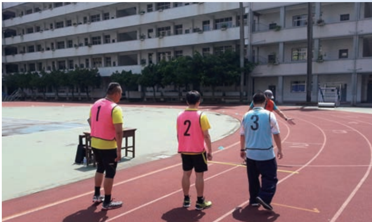
術科實作項目：跑步測試

電腦應試成績表單中呈現強弱分析，應考人可透過此分析，瞭解本身在專業上之強弱項目，未通過者亦可針對有待加強之處，訂定下次應試準備方向。另配合金融常識與職業道德 5 年期限展期規定，規劃系統性作業，方便應考人申請展期。