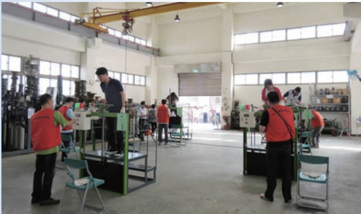
術科實作項目：水門操作