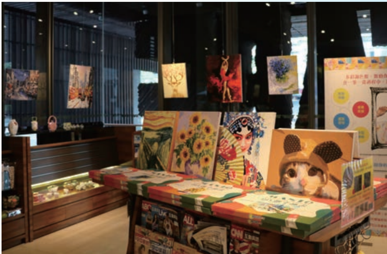
數字油畫——畫布上旅行特展