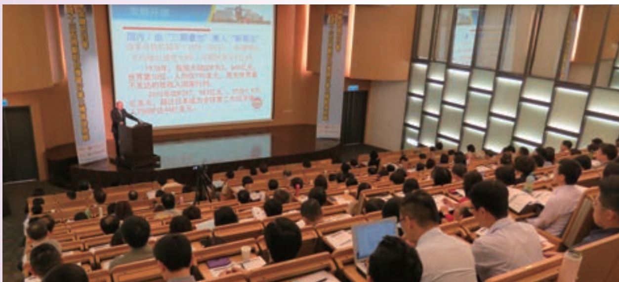
5月「大陸十三五規劃對台灣銀行業之機會與挑戰」邀請西北政法大學及廈門銀行等機構之專家分享探討大陸邁入十三五時代後，台灣銀行業經營對岸市場之新戰略