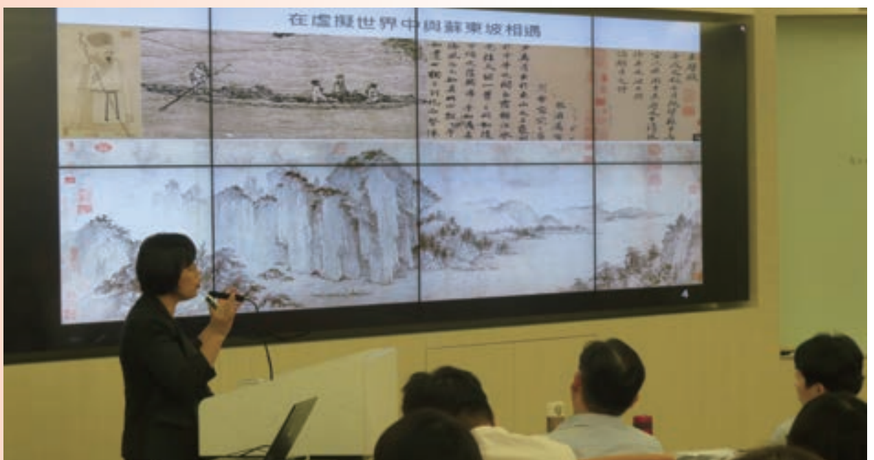
7月創意產業融資案例研習班