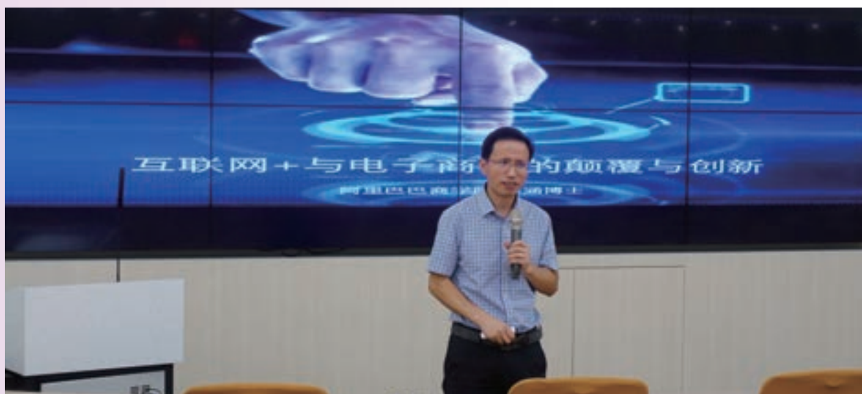
7月「電子商務結合互聯網的顛覆與創新研習班」，邀請阿里巴巴商學院裘涵副教授來台演講