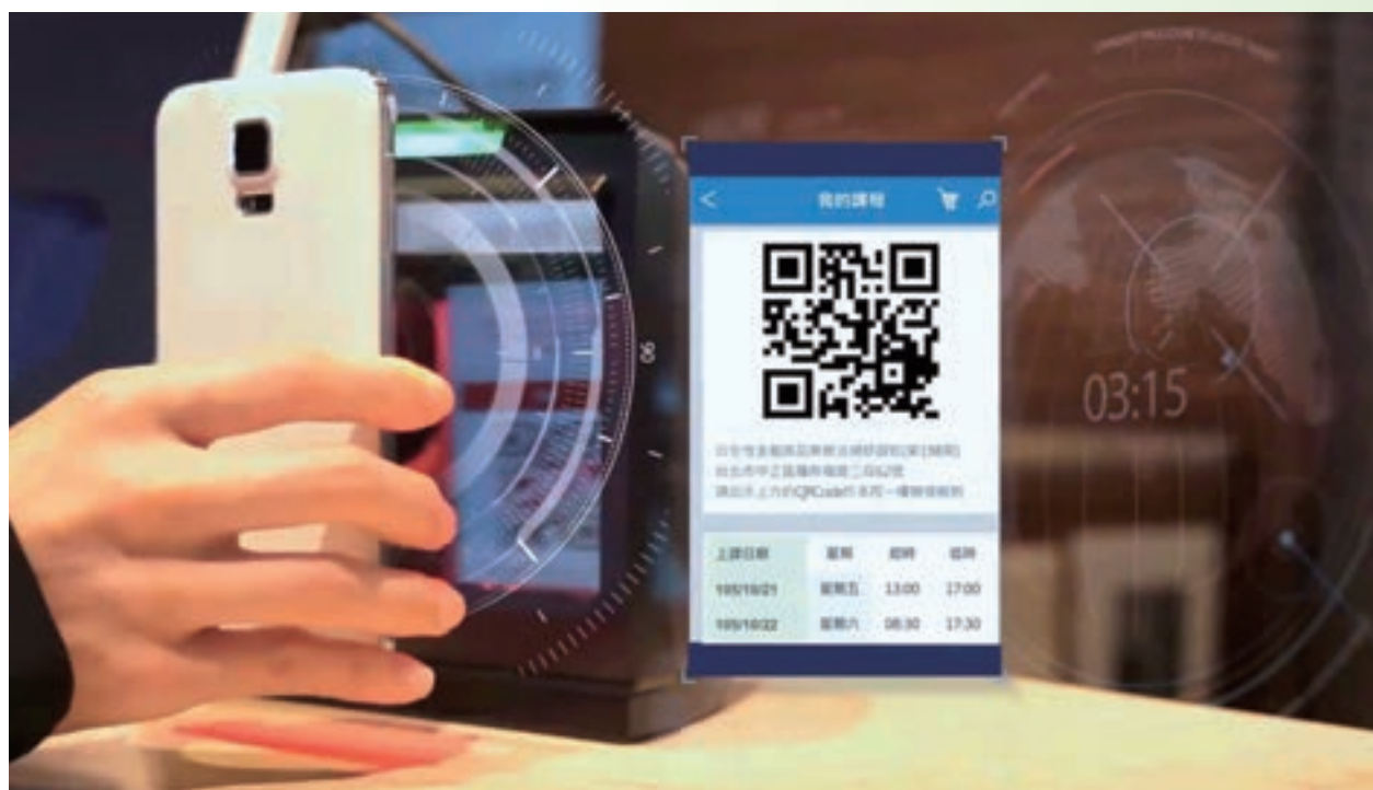
行動裝置學員報到系統

鑒於學員消費方式與業者服務型態之改變，本院提供跨平台之行動版網頁，提供使用者更多元化的選擇，讓研訓院學員透過行動裝置能夠迅速找到所需要的課程，並提供行動學習平台，突破地域空間藩籬，隨時隨地上網進修，打造便捷的數位學習環境，更有助於金融知識的推廣；同時也提供線上測驗、線上證書等服務，讓學員隨時隨地皆能查詢成績並列印證書，貼近與學員間的距離。