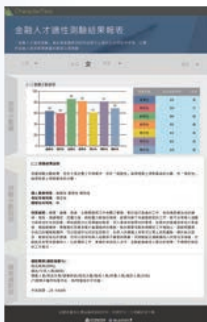
金融人才適性測驗

為因應數位金融浪潮之環境變遷，本院自今年度起，協同國立臺灣師範大學教育心理與輔導學系，重新檢視目前現有版本之金融人才適性測驗題目，並針對新職務類別設計題目，以符合當代金融人才之需求，期透過此測驗結果，受測者可瞭解自身人格特質，亦可提供金融機構做為徵才、職務調動、職能訓練之參考依據。第一版之適性測驗上線至今，受測總人數已超過一萬人次，新版適性測驗預計於 106 年全新上線。