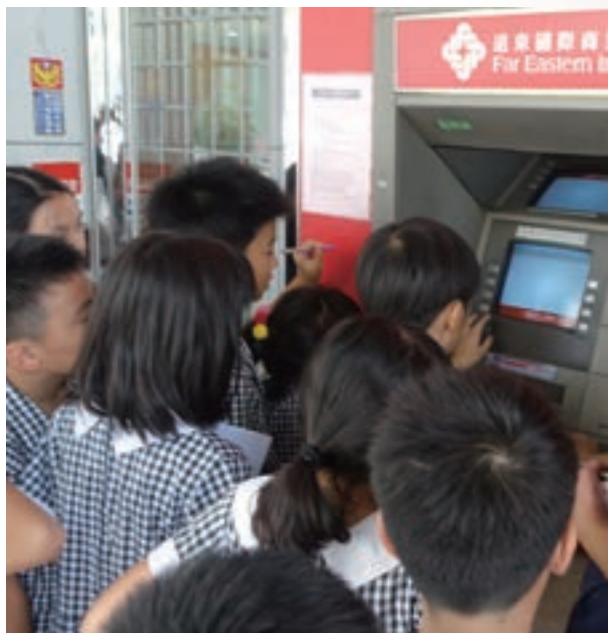
作中學 學中作 金融好有趣

廣金融教育訓練與研究工作，已累積豐富的經驗與厚實基礎，對落實基礎金融常識教育的工作，自是責無旁貸。