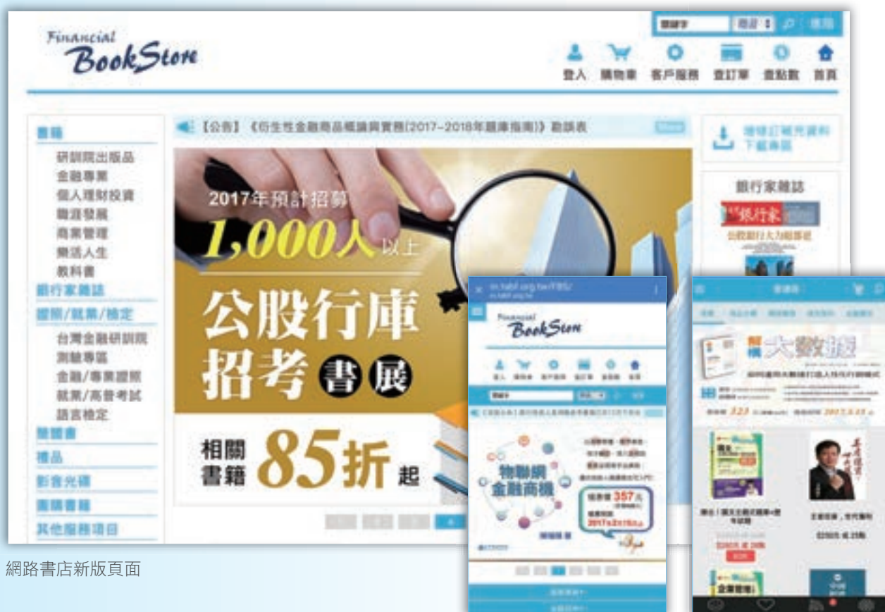
網路書店新版頁面

此外，為感恩各界支持與愛護，善盡金融教育財團法人之社會責任，於105年8月起，將《台灣銀行家》雜誌收入半數捐助「資深金融人才社會回饋服務平台」，協助媒合優秀的資深金融人才續以所長貢獻社會，促進金融知識資訊充分交流，發揮社會影響力。