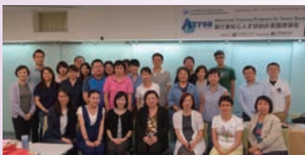
與銀行公會合作辦理「銀行業核心人才培訓計畫國際課程」系列性研習活動，深獲學員好評

城市商業聯盟、期貨、信託等各類型金融機構密切合作，邀請對岸金融業高管菁英組團來台學習考察，與台灣金融業界切磋交流。2016年度本中心辦理之重要兩岸金融交流活動包括：上海市銀行同業公會「百年公會金融文化調研團」活動、首都金融服務商會金融考察團參訪、廣西金融辦組團來院培訓考察，活動中邀請國內專家從台灣金融發展經驗之觀點，分享交流銀行業務轉型策略及未來發展契機。