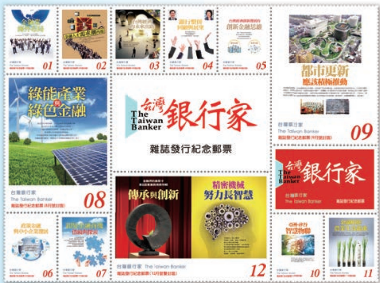
銀行家雜誌——報導最新金融新知與趨勢分析議題