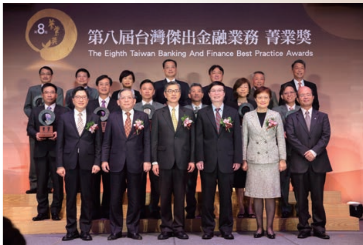
第八屆菁業獎特優機構合影

本屆計有 39 家金融機構提出 90 件案件參選，打破歷年紀錄。而在評選陣容上，本屆陣容比起