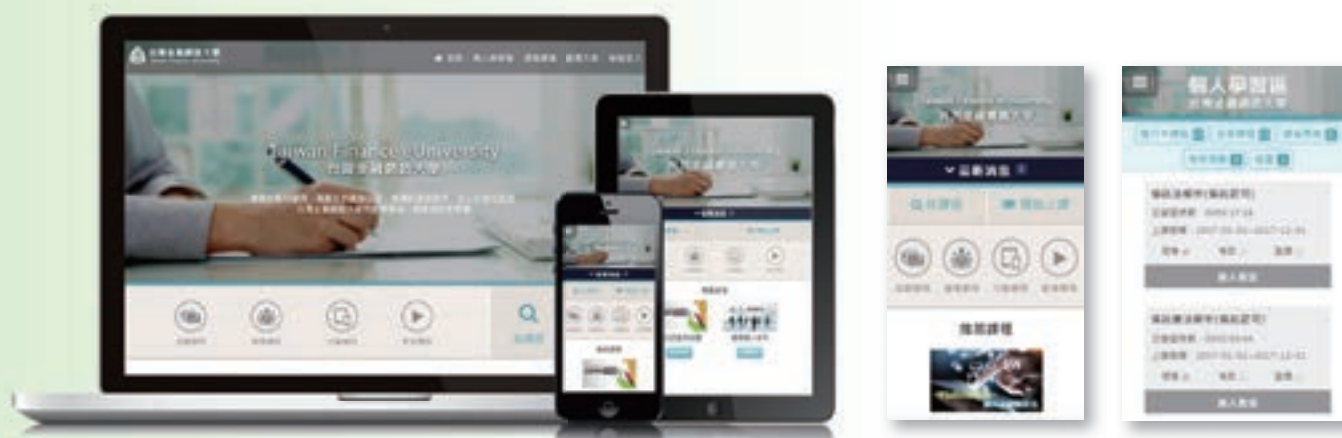
台灣金融網路大學