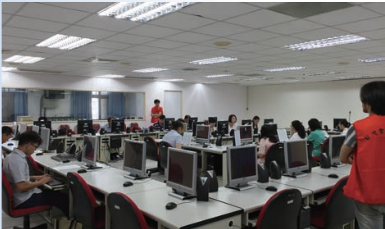
術科實作項目：電腦打字測驗