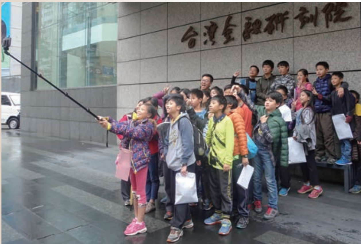
金融研訓院與你「童」在一起

金融教育的推廣是一項漫長且需永續經營的事業，尤其面對全球金融環境的劇烈變化，如何讓金融教育往下扎根，將愈形重要。金融研訓院長期推