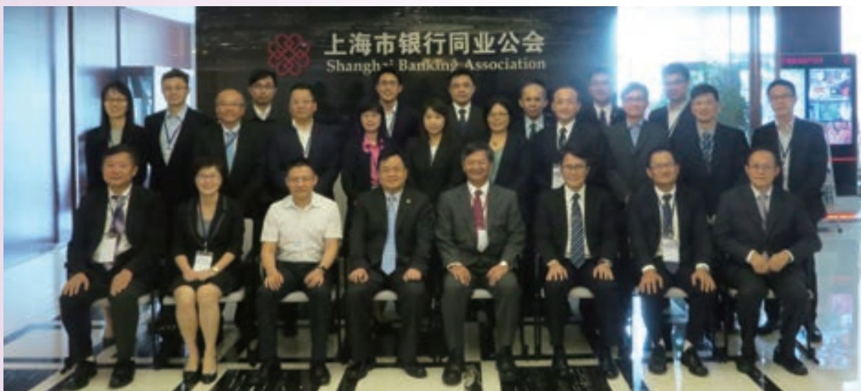
9月「大陸互聯網金融與支付創新研習團-上海」深度聚焦大陸互聯網金融、協力廠商支付平臺、互聯網理財及互聯網產業等相關議題