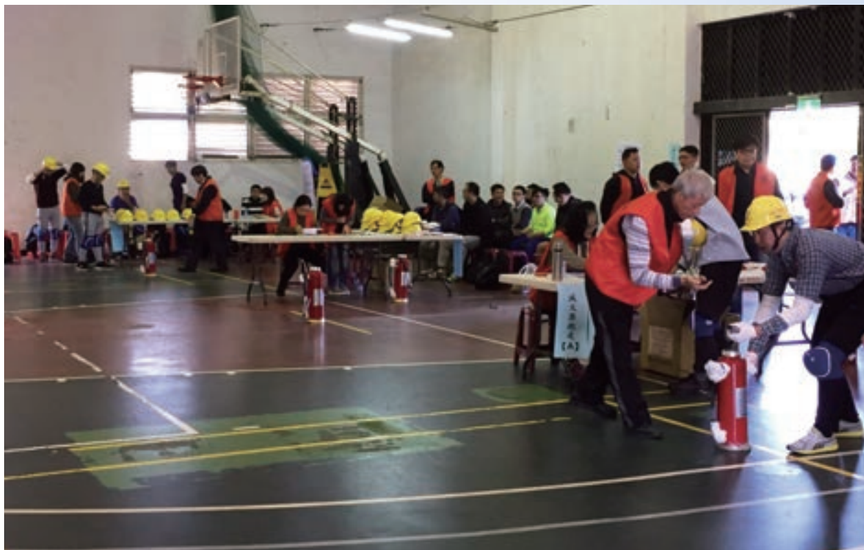
術科實作項目：滅火器跑走

順應金融數位化與國際化趨勢，特與本院金融研究所合作「科技及海外金融人才職能研究案」，調查研究科技金融與派外金融人員應具備之職能，以提供培訓、甄選及輪調之參考。