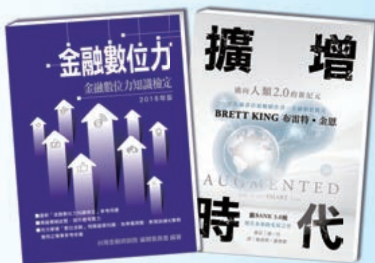
《金融數位力》及《擴增時代》滿足數位金融趨勢

本院秉持「傳遞金融知識、普及金融教育」理念，因應金融政策與相關知識之推廣，同時深耕校園金融教育與傳承，傳播出版中心致力開發多項優質金融專書，尤其近幾年因應數位金融趨勢潮流，於 2016 年出版《金融數位力》及《擴增時代》等書籍，延續數位科技革新議題，強化專業兼顧多元知識，並努力以金融從業人員符合潮流之新職能及競爭力為使命，以達啟動新思維並開拓新數位金融契機。回顧 2016 年新書發行計 30 種，總計出版品達 600 餘種，全年書籍銷售量 7 萬餘冊，包含金融相關推廣教材並配合金融專業證照及測驗，持續更新測驗參考用書，未來更持續引進國際金融新知、銀行法令遵循制度、數位銀行經營策略、數位金融趨勢及大數據分析等，以充實金融專業人才之底蘊與能量為己任。