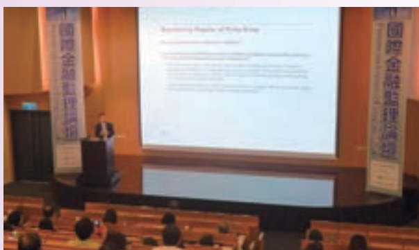
「金融檢查與稽核系列研討會」邀集國內外優秀專家共同研討金融政策與內稽實務關鍵議題

陸互聯網金融與支付創新研習團」、「FinTech 保險金融考察團」等海外考察活動，安排國內金融界優秀菁英及大專院校教師赴海外研習考察，與海外金融主管機關及業界高階決策主管請益交流。