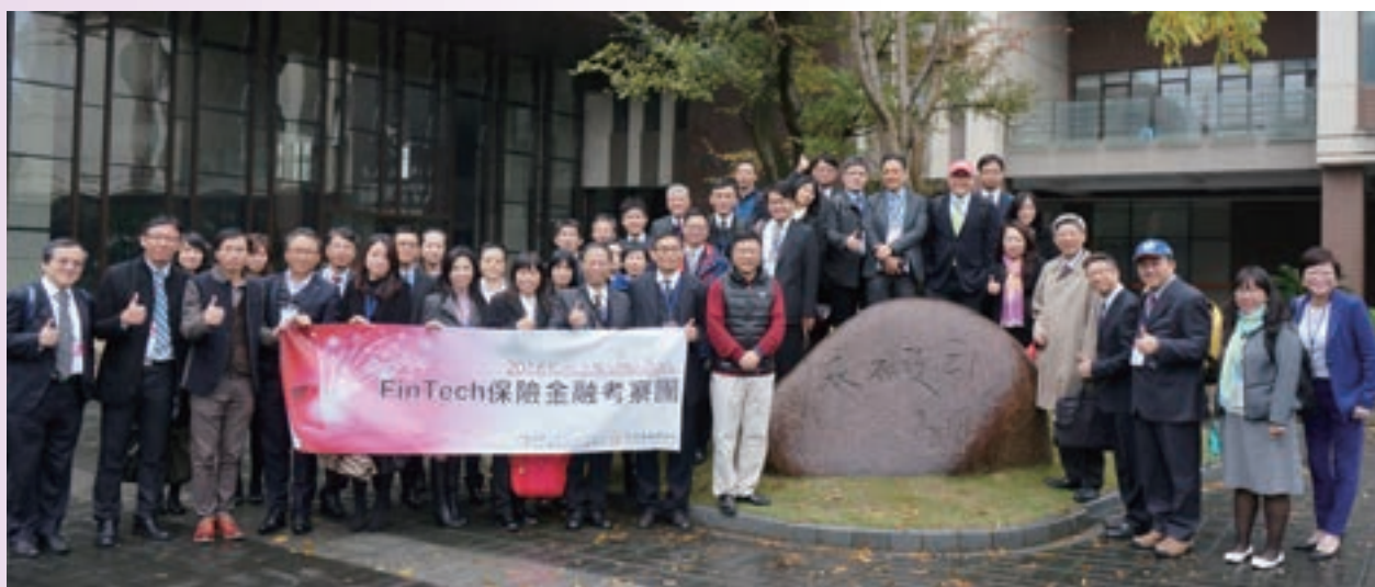
11月「FinTech 保險金融考察團」與保險事業發展中心首次合作於杭州、上海共同舉辦，深入了解大陸保險公司、互聯網金融公司、大數據與電商平台等 FinTech 下金融創新之議題