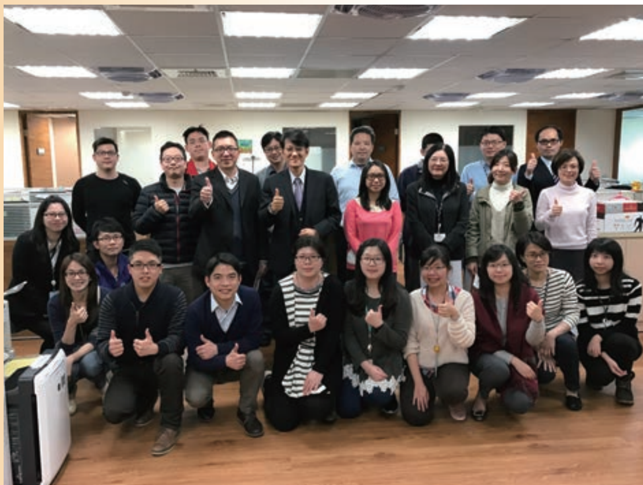
金融研究所成員合照

之研究」、「我國金融機構海外合資、參股與併購之趨勢與策略」、「銀髮金融產業國際發展趨勢及我國銀髮金融商機之研究」、「我國金融業因應氣候變遷作法之研究」、「都市更新銀行融資與財務機制之研析」、「政府推動創新型產業導向社會下金融支持與策略發展模式」等研究計畫，深入探討其關鍵性的發展趨勢，作為政府與民間單位在政策擬定的參考依據。近年來，科技不斷演進，創造出新型態的金融產業生態，全球金融機構與科技業者搶先開發及利用區塊鏈技術與大數據導入風險控管，以建立更具安全性環境。本所亦針對這些現況進行分析，例如在「區塊鏈及數位貨幣在金融業的影響與應用」與「銀行業因應網路金融發展之風險監理及稽核研究」，探討網路的底層技術，以及如何透過網路的技術協助企業提升作業系統的安全性；「運用巨量資料建構支持綠色新創產業之融資信用風