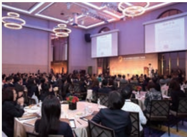
頒獎典禮盛大隆重 得獎金融機構備感尊榮

「第八屆台灣傑出金融業務菁英獎」頒獎典禮，已於 105 年 12 月 13 日下午二時假台北大直萬豪酒店盛大舉行，二年一度的金融業菁英風雲盛會冠蓋雲集，金融先進、各界賢達及得獎機構代表齊聚一堂，共同見證臺灣金融業創新、前瞻的優異表現。