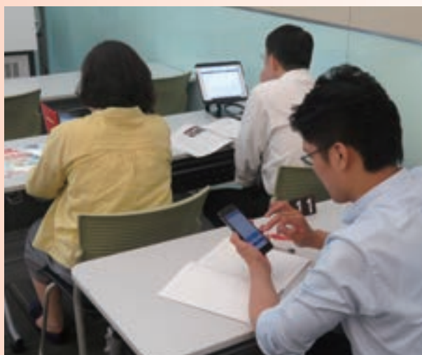
11月翻轉學習課程——學員操作雲端互動工具

民親子理財教育，增進儲蓄理財的親子對話，期勉新住民二代學子發揮母語優勢，立志投入金融業發展；舉辦「金融工作的探索旅程」，增加學子接觸金融實務機會，培養投入金融業所需之專業能力。創立「資深金融人才社會回饋服務平台」，召集超過100位資深金融前輩，投入「新創事業與中小企業財務諮詢」、「至大專院校講授實務課程」、「至中小學宣導金融知識」、「宣導金融詐騙與洗錢防制」等事務，以促進產學合作及新創事業發展，並於每月底舉辦「金融銀髮樂活學習講堂」系列免費講座，提供長者多元豐富的樂學習平台，充實退休生活，營造「健康樂活，關懷回饋」安可人生新模式。