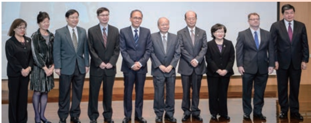
11月「支持綠能產業·發展綠色金融」研討會