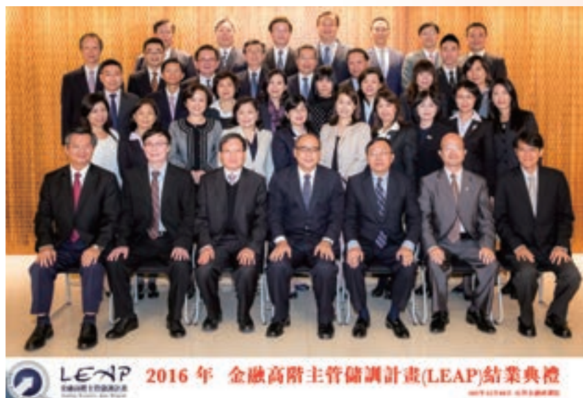
12 月「金融高階主管儲訓計畫 (LEAP)」結業典禮合影

配合政府產業方針，為鼓勵國內金融業者深入了解新興產業特性及相關風險，達成活絡民間資金動能及促進產業經濟發展目標，舉辦「避開 921 地震的危險基因・讓防災型都更真正防災研討會」、「支持綠能產業・發展綠色金融研討會」及承辦銀行公會「2017 年產業分析及展望系列論壇」，研發「都更金融」、「綠色金融」、「文創金融」等新興金融系列課程，促進金融業與產業界對話交流，進而發展多元且可行之籌資、融資及投資管道，透過金融支持產業促進永續「價值」經營，創造金融與產業雙贏。